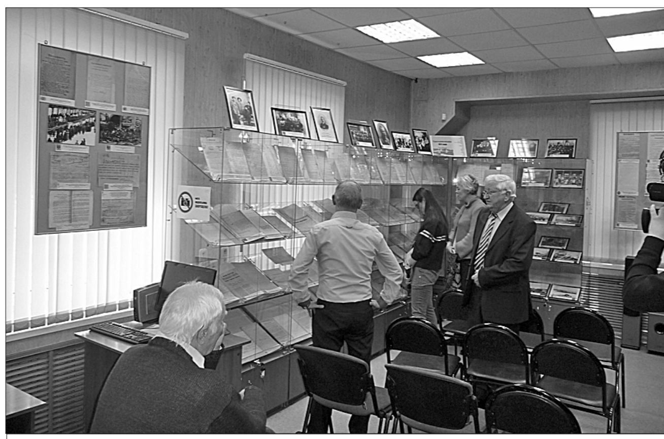
Первые посетители знакомятся с материалами экспозиции Центра документации.

Скажем, сотрудники Центра документации прекрасно понимали, что для полноценной работы выставки потребуется более просторное помеще-