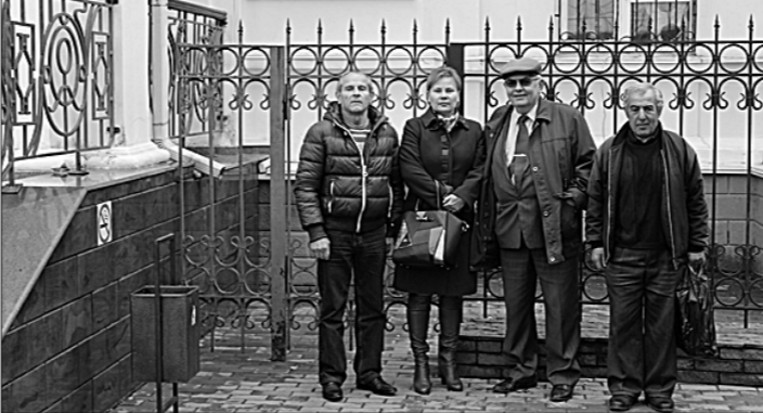
Чинovníки гуковской администрации, стремясь задуть протестное движение, приготовили обманутым шахтёрам очередную сюрприз. По их мнению, Федеральный закон от 19.06.2004 г. №54-ФЗ «О собраниях, митингах, шествиях и пикетированиях» предусматривает, что публичное мероприятие не может длиться более 1 (одного) дня. Потому и не согласовали проведение постоянно действующего пикета, заявленного с 8 ноября до 20 марта 2018 года. Отказ получен и на согласование обычного однодневного пикета. Причина — площадка у здания шахтоуправления ГК «Кингкоул» не внесена в пере-

7 ноября, в день празднования 100-летия революции, пикетчики решили: протест продолжить до полного выполне-